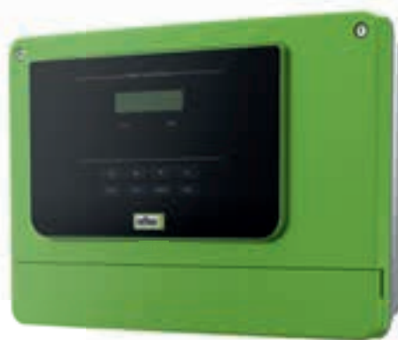
Control Basic Bedienfeld